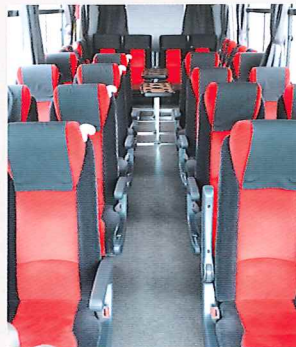
補助席を設けておりませんので車内移動もスムーズに