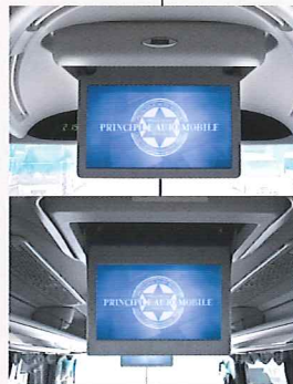
主テレビ(前)+増設テレビ(後)